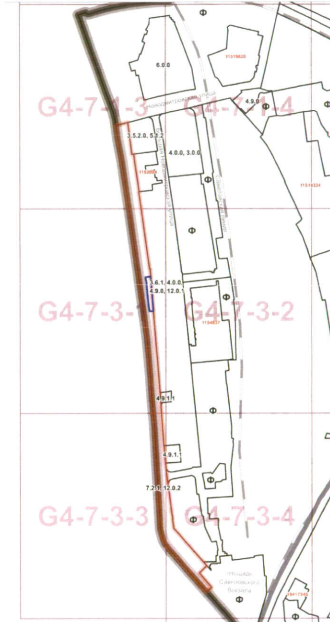
Схема границ подготовки проекта внесения изменений в правила землепользования и застройки города Москвы в отношении территории по адресу: г. Москва, ул. Бутырская, вл. 56 (кад. № 77:02:0021015:85), СВАО

Приложение к распоряжению Москомархитектуры от 31.01.2018 г. № 51